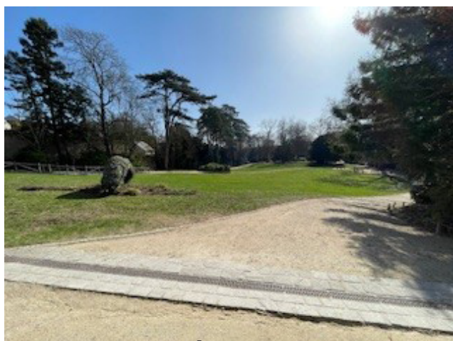
Pente à 13%

De nombreux bancs sont à disposition sur le parcours de visite.