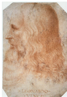
Francesco Melzi (attribué à) Portrait de Léonard c. 1503 - 1518 Windsor Castle, Royal Library