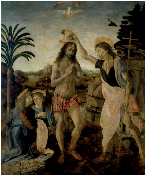
Léonard de Vinci Le Baptême du Christ Vers 1468-1478 Galerie des Offices, Florence

Vers 1467 : âgé de 15 ans, il entre dans l'atelier du peintre, sculpteur, orfèvre et ingénieur Andrea del Verrocchio. Il s'agit de l'un des ateliers polytechniques les plus importants de l'époque. Il y fait son apprentissage et travaille aux côtés de son maître sur Le Baptême du Christ . Il peint l'arrière-plan et un des anges qui, en raison de sa beauté, l'impose comme peintre.