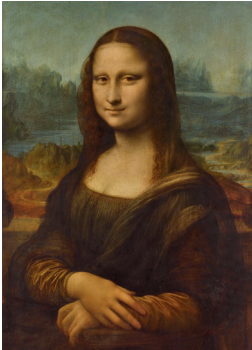
Léonard de Vinci La Joconde 1503 - 1519 Musée du Louvre, Paris