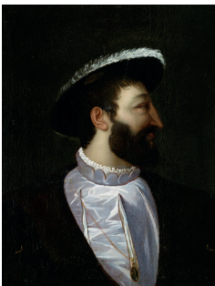
Pierre Révoil Portrait de François I er (d'après Titien) xix e siècle Collection privée, château du Clos Lucé

14 mars 1516 : quelques mois après la victoire de Marignan, François I er adresse une lettre à Léonard de Vinci.