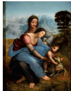
Léonard de Vinci La Vierge, l'Enfant Jésus et sainte Anne 1503 - 1519 Musée du Louvre, Paris

Pendant cette période itinérante, Léonard de Vinci est à l'apogée de sa renommée. Il entre en compétition avec de jeunes peintres talentueux, Michel-Ange et Raphaël. Vers 1503, il commence à peindre La Vierge, l'Enfant Jésus et sainte Anne , dit La Sainte Anne , et La Joconde .