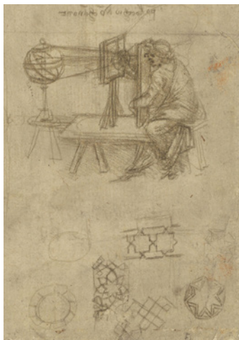
Léonard de Vinci, Codex Atlanticus , folio 5 recto (détail), fin du XV e siècle

Par groupe de 20 personnes, les visiteurs sont invités à fabriquer leur propre sténopé, une sorte d'appareil photo en carton, pour découvrir le principe de la camera obscura à l'origine de la photographie. S'ils suivent les indications de la médiatrice, ils parviendront à prendre une photo avec leur sténopé et pourront repartir avec un souvenir de leur journée.