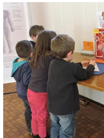
Atelier du cœur

Si un animateur est présent pour assurer les expériences complexes et guider les enfants qui le souhaitent, l'autonomie dans la manipulation et l'expérimentation est au cœur de la démarche souhaitée par la FRMJC et en adéquation avec celle de Léonard. Celui-ci, qui n'est pas allé à l'université, a appris de ses observations de la nature en véritable autodidacte.